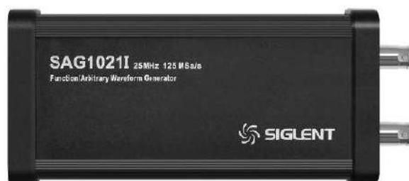
Программно-аппаратная опция внешнего модуля функционального генератора (SAG1021I).