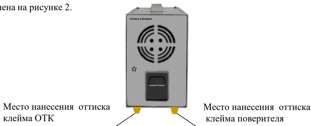
Рисунок 2 – Место нанесения оттиска клейма поверителя и оттиска клейма ОТК (вид источника питания сзади)

1.5.3 Схема пломбирования источника питания от несанкционированного доступа с указанием мест нанесения оттиска клейма ОТК и клейма государственного поверителя представлена на рисунке 2.