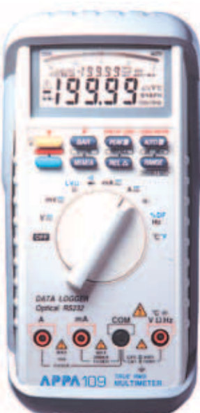
APPA 107N / 109N