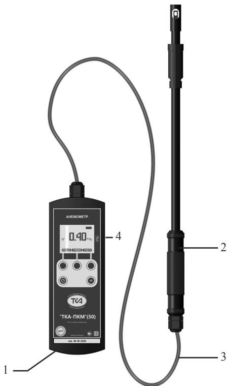
Рис.1. Внешний вид прибора “ТКА-ПКМ”(50)