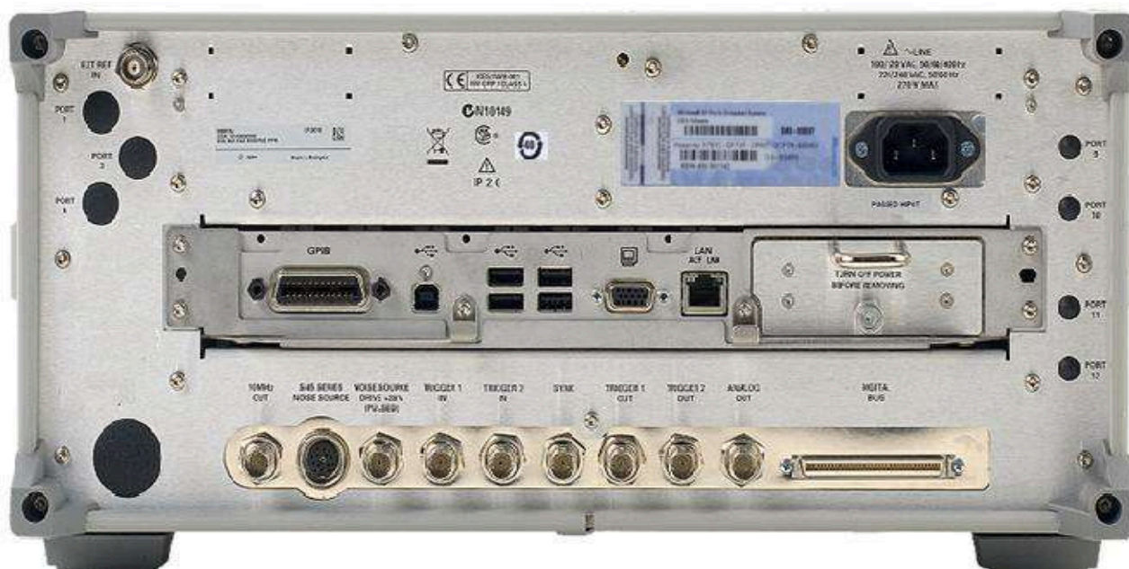
Места пломбирования от несанкционированного доступа