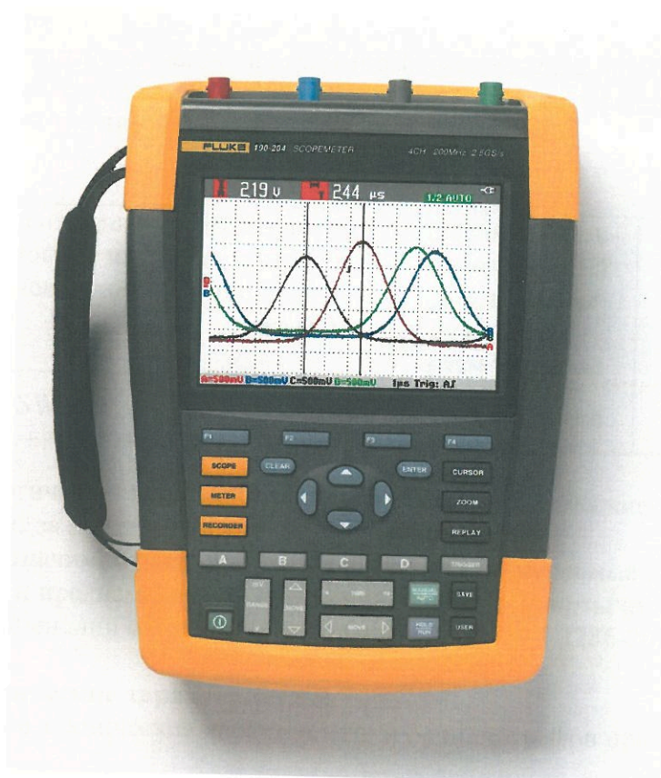
Рисунок 1 - Общий вид осциллографов Fluke 190-104, 190-204