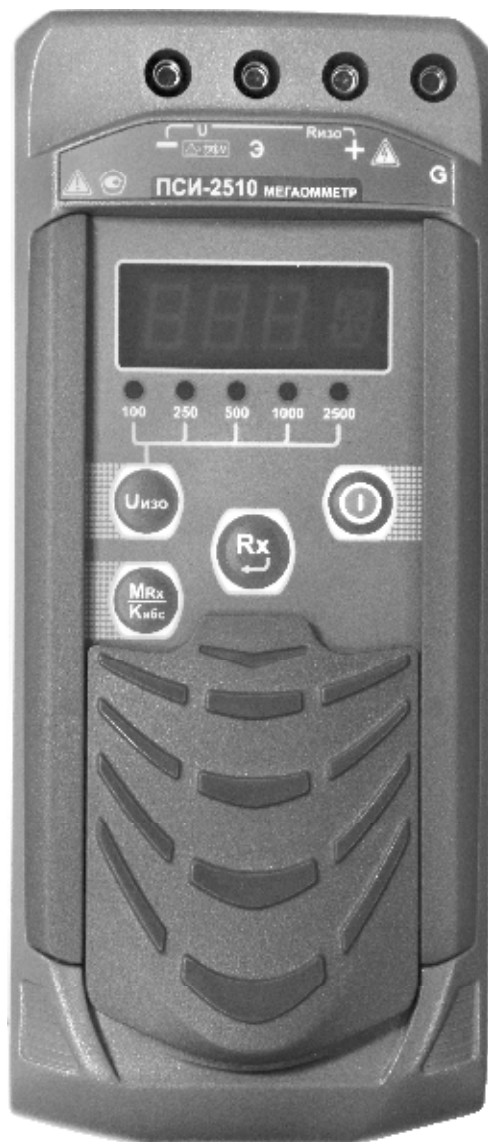
Рисунок 1 – Общий вид мегаомметров ПСИ-2510. Вид спереди

Общий вид мегаомметров представлен на рисунках 1 – 4. Схема пломбировки от несанкционированного доступа представлена на рисунке 5.