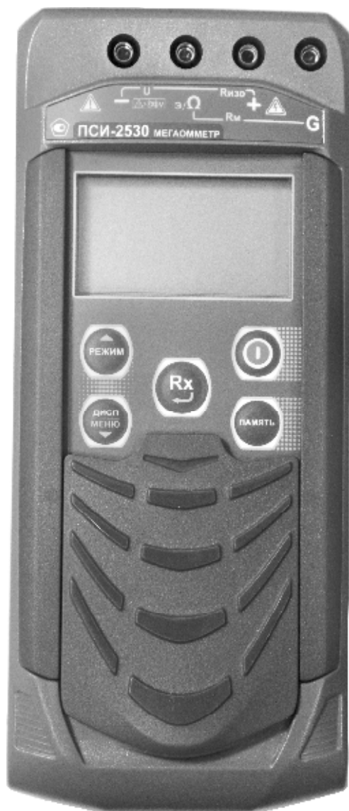
Рисунок 3 – Общий вид мегаомметров ПСИ-2530. Вид спереди