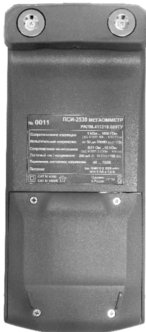
Рисунок 4 – Общий вид мегаомметров ПСИ-2530. Вид сзади