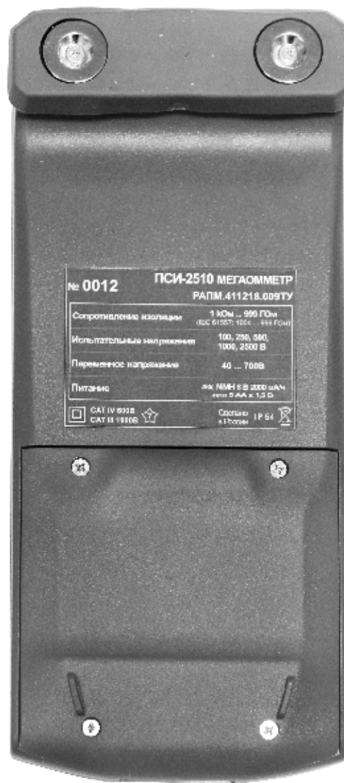
Рисунок 2 – Общий вид мегаомметров ПСИ-2510. Вид сзади